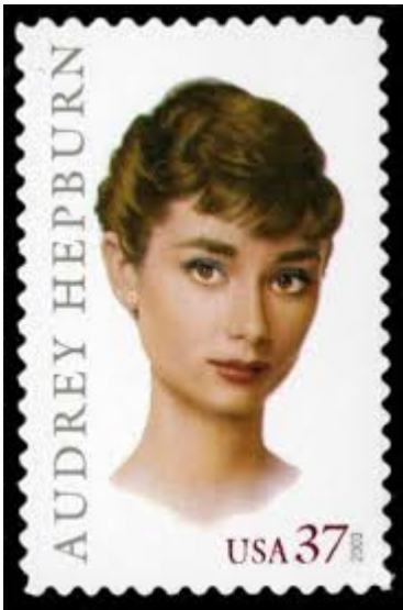
Figuur 1 Audrey Hepburn USA uitgave 2003-06-11

Zou men de golvende haardracht van Audrey Hepburn nagestreefd hebben zoals op deze USA postzegel uit 2002. Of de haardracht van de vrouw op de Franse postzegel uit 1946?