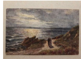
Figuur 2 Bijloos strandgezicht