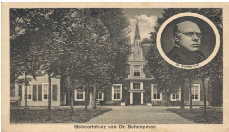
Figuur 3 Geboortehuis van Dr. Schaepman te Tubbergen