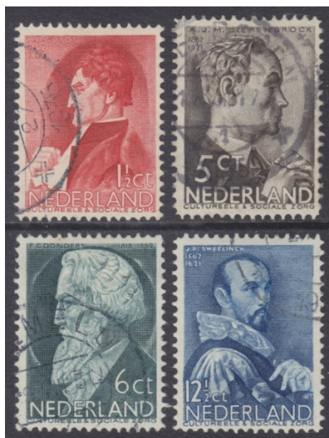
Figuur 1 1e Nederlandse Zomerzegels 1935

Sinds 1993 gaat de toeslag naar organisaties voor ouderenwerk. Hierdoor hebben de zegels tevens de bijnaam Ouderenzegels verworven. De eerste serie zomerzegels werd in 1935 uitgegeven. (fig. 1) Daarna werd elk jaar een serie zomerzegels uitgegeven, met uitzondering van de periode 1942 – 1946. TNT Post heeft besloten vanaf 2011 géén Zomerpostzegels meer uit te geven. Tot en met 1948 zijn op deze postzegels 36 mannen en 2 beroemde vrouwen afgebeeld.