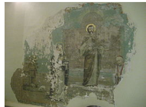
Figuur 5 Viering Dogma van de Pauselijke onfeilbaarheid