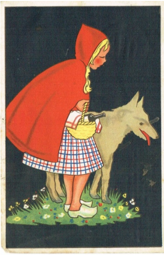
Figuur 3 Rood kapje en de boze wolf

Vermoedelijk was Lena een kind wat pas had leren zwemmen en zij liet dit trots aan een ander kind weten. (De kaart was geadresseerd aan de jonge juffrouw.....). Op de voorkant van de kaart staat een afbeelding van Rood Kapje en de Boze Wolf, de tekening is van Lies van Willis. Lies van Willes heeft meer kaarten voor Bijloos getekend.