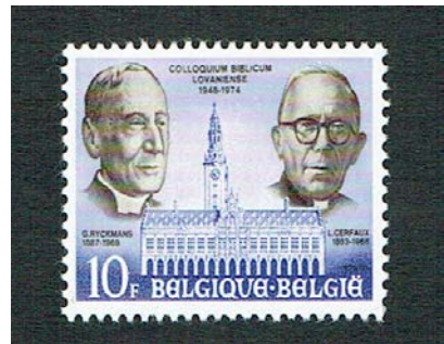
Figuur 3 Voorgevel Bibliotheek Katholieke Universiteit Leuven

Bekend werd hij in die periode door zijn "Romeinse reisbrieven" waarin hij verslag deed van gebeurtenissen en de indrukken die het Concilie op hem maakten. Na het concilie verliet hij Rome en werd hij hoogleraar kerkgeschiedenis aan het Grootseminarium Rijsenburg te Driebergen.