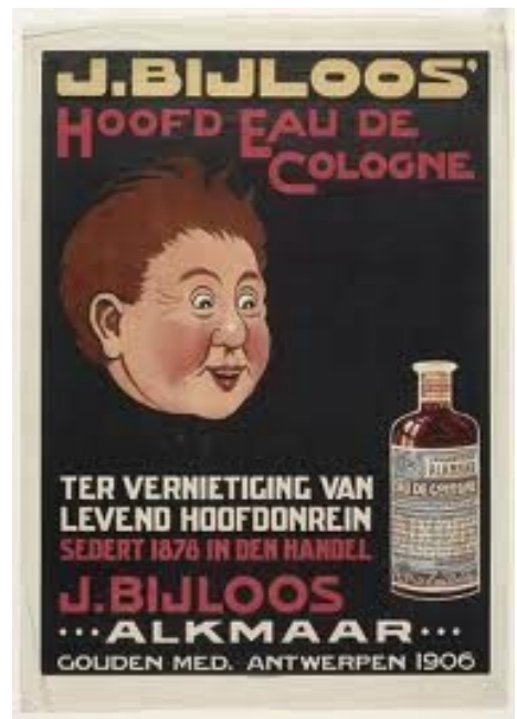
Figuur 4 J. Bijloos Alkmaar Hoofd Eau de Cologne

Ik vond een poster met een afbeelding van een fles Hoofd Eau de cologne op de website van Peter in 't Groen die met zijn metaaldetector het land afstruint en in dit geval een flesje van Bijloos op een voormalige Tilburgse vuilnisbelt vond. Op zijn website stond dit flesje vermeld en afgebeeld, tevens stond daar de betreffende poster.