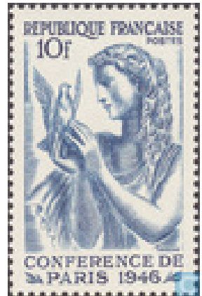
Figuur 2 Vredesconferentie 1946

Het bedrijf J. Bijloos schijnt bestaan te hebben in de periode 1928-1940. (bron: Museum Rotterdam )