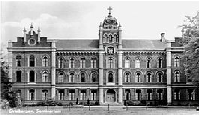
Figuur 4 Grootseminarium Rijsenburg te Driebergen