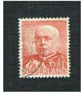
Figuur 2 Dr. Schaepman NVPH 285

Hermanus Johannes Aloysius Maria Schaepman werd geboren te Tubbergen (Overijssel) op 2 maart 1844 (fig.3) en stierf in Rome op 21 januari 1903. Schaepman werd in een rooms-katholiek gezin in Twente geboren.